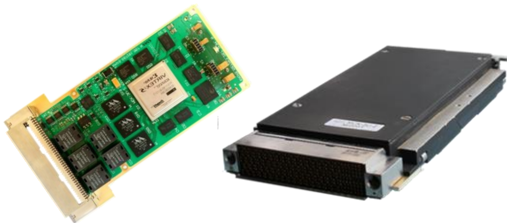
Рисунок 1. Модуль сетевого коммутатора каналов ARINC 664 AFDX.

Для организации сетей ARINC 664 AFDX в комплексе БРЭО разработан модуль сетевого коммутатора МСК-3U-2, представленный на рисунке 1. Модуль предназначен для применения в как в гражданской, так и в военной аппаратуре. Поскольку стандарт ARINC 664 широко распространён модуль оптимально подходит для комплексов гражданской авиации и комплексов предназначенных иностранному заказчику. Модуль выполняет функции коммутатора 24 каналов стандарта ARINC 664 AFDX, гарантирует детерминированное время доставки информации, защищает комплекс от неисправной работы абонента, позволяет конфигурировать и производить мониторинг сети штатными средствами БРЭО.