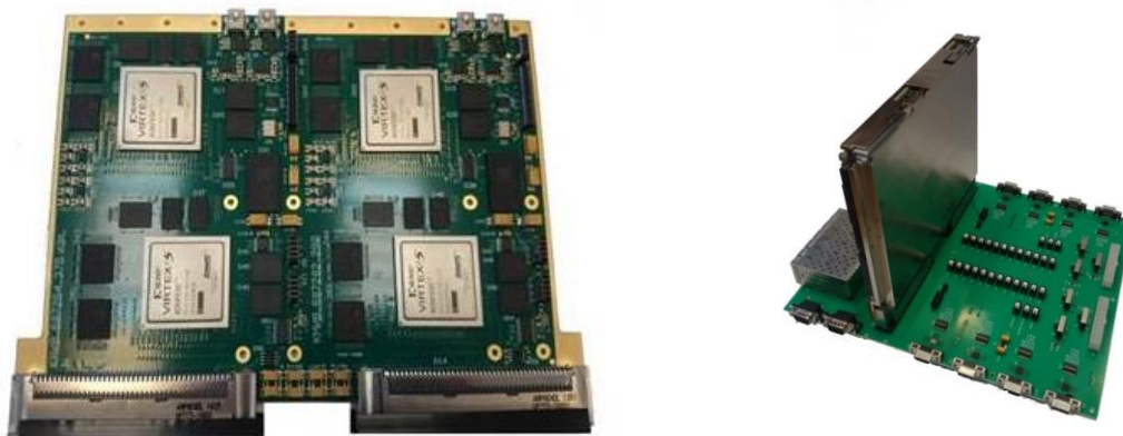
Рисунок 2. Модуль внутреннего коммутатора MBK 6016.

технологии Fibre Channel. Для технологии Fibre Channel нет общеизвестного протокола для авиационного применения. Для решения этой проблемы в данной работе был разработан протокол «Авиационных детерминированных сетей», в котором используются принципы ARINC 664 наложенные на физический уровень Fibre Channel. Для развёртывания вычислительной сети в комплексе БРЭО разработан модуль внутреннего коммутатора MBK6016, представленный на рисунке 2.