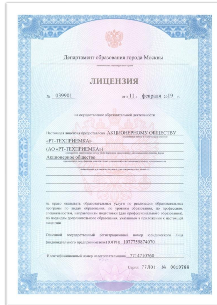
Лицензия Министерства образования города Москвы на право осуществления образовательной № 039901 от 11.02.2019.

Центр обучения оказывает образовательные услуги по программам дополнительного профессионального образования в рамках лицензии Министерства образования города Москвы